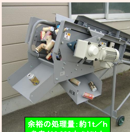
余裕の処理量：約1t/h 参考(20,000本/h)以上