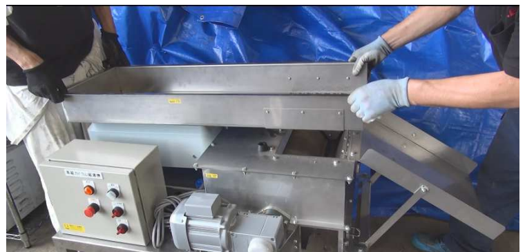
振動装置全体で約30kgです